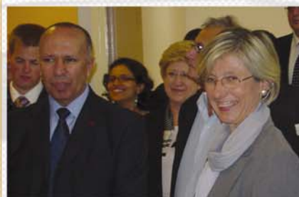
En compagnie du Recteur de l'Académie d'Amiens.