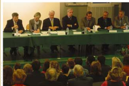
En compagnie du Ministre de l'Education Nationale française.

une formation de courte durée destinée aux bacheliers mais également aux élèves de niveau Bac.