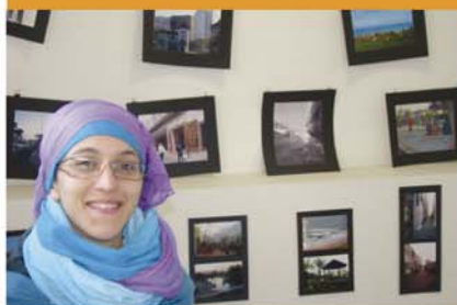
Nora El Haddad, Club Photographie

Il en résulte dans tous les cas une expérience unique et formatrice.