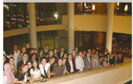
Les étudiants d'IPLT Tanger & IPLT Casablanca